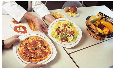
ANDREAS BOHNSTENGEL / Wikimedia / CC BY-SA 3.0

Beschäftigte der Entgeltgruppe 7, die schwierige Aufgaben* erfüllen.